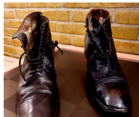
Dilemmavragen vaste presentatie & Schoenen van Titus Brandsma collectiepresentatie in CHC De Tiid