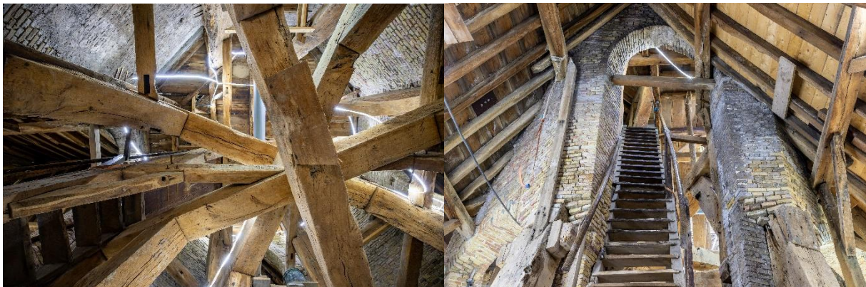
Gerestaureerde torenconstructie stadhuistoren Bolsward

Door de uitloop van een aantal restauratie en herstelwerkzaamheden in het onderste deel torenconstructie is de toren presentatie pas in nov 2021 opgeleverd. Door de coronamaatregelen is de officiële opening van de toren uitgesteld tot begin 2022. De ruimte onder de balkenlaag van de torenconstructie, de plek van de oude Oudheidkamer is niet gerestaureerd. Stichting HCW heeft deze ruimte om niet van de Gemeente SWF in beheer. Er wordt onderzocht hoe deze ruimte museaal geschikt te maken is voor toekomstige museale presentaties.