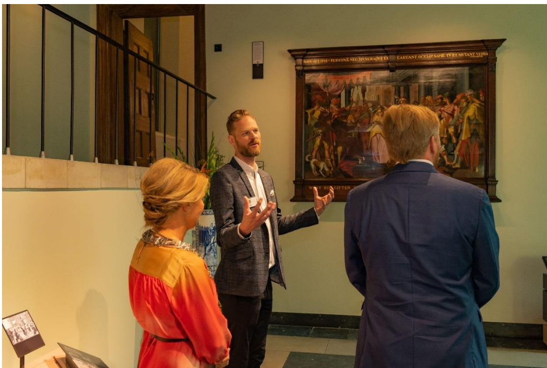
07-09-2011 Koning Willem-Alexander voor net gerestaureerde Salomons rechtspraak

Tijdens de restauratie is een ouder schilderij onder het huidige werk aangetroffen, vermoedelijk uit 1579. In samenwerking met Stichting Bolsward Historie zal vanaf begin 2022 gewerkt worden aan een digitale ontsluiting van het verhaal achter het schilderij en de resultaten van het kunsthistorisch onderzoek.