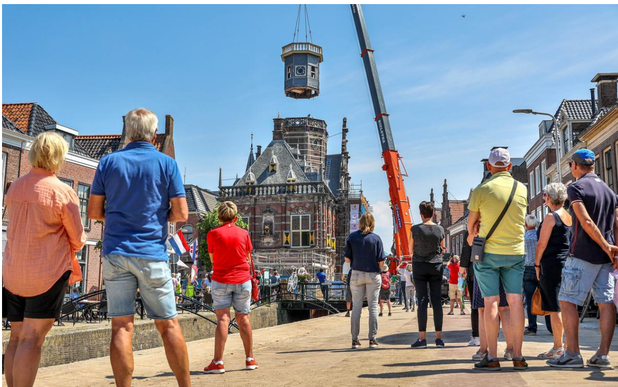
08 – 07 – 2021 terugplaatsing stadhuistoren

Sinds 2015 is nagedacht over de invulling van de museumfunctie als " Huis van verhalen " en is er vooronderzoek gedaan naar de inhoudelijke achtergrond. In december 2019 werd een onafhankelijke museumstichting opgericht: Stichting Historisch Centrum Westergo (HCW). Stichting HCW exploiteert het museum, museumwinkel, VVV informatiepunt en horeca- en trouwlocatie in Cultuur Historisch Centrum De Tiid. De horecalocatie wordt via doorverhuurconstructie geëxploiteerd door een externe partij. Daarnaast geeft de stichting het mede koers aan de inhoudelijke totstandkoming en de programmering van het centrum als geheel.