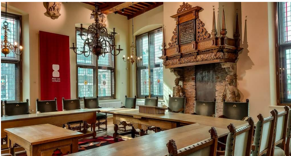
Gesatureerde raadzaal historisch stadhuiscomplex

Ter voorbereiding voor toelating tot het museumregister heeft Stichting HCW het museale deel van CHC De Tijd aangemeld onder de naam Huis van verhalen , Museum De Tijd. Dit om een duidelijk onderscheid te maken met de overige partijen in De Tijd. Daarnaast is Museum De Tijd onderdeel geworden van internationaal samenwerkingsverband van International Council of Museum (ICOM) in de vorm van de sub comité: CAMOC (International Committee for the Collections and Activities of Museums of Cities) en COMCOL (International Committee for Collecting).